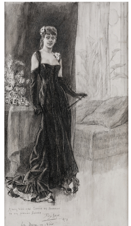
F. Rops, La Dame en noir, détail, 1879, dessin.

« Collectionner. Victor Arwas & Félicien Rops » est l'occasion de s'intéresser à des questions plus larges concernant les collections. Quelles sont les spécificités d'une collection publique et comment celle d'un privé peut-elle compléter la vision et la recherche sur un artiste. Pour un musée monographique, comment un fonds privé peut-il apporter une nouvelle approche sur l'œuvre ? De manière générale, quels sont les aspects de l'œuvre ropsienne qui attirent les collectionneurs et comment décident-ils si une œuvre mérite d'être acquise ? Comment distinguent-ils un vrai d'un faux, une pièce rare d'une sans grande valeur ?