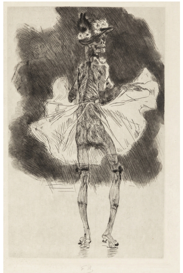
F. Rops, La Mort qui danse, 1865, gravure. Arwas Archives.

Merci de confirmer votre présence à info@museerops.be pour le 7 avril au plus tard.