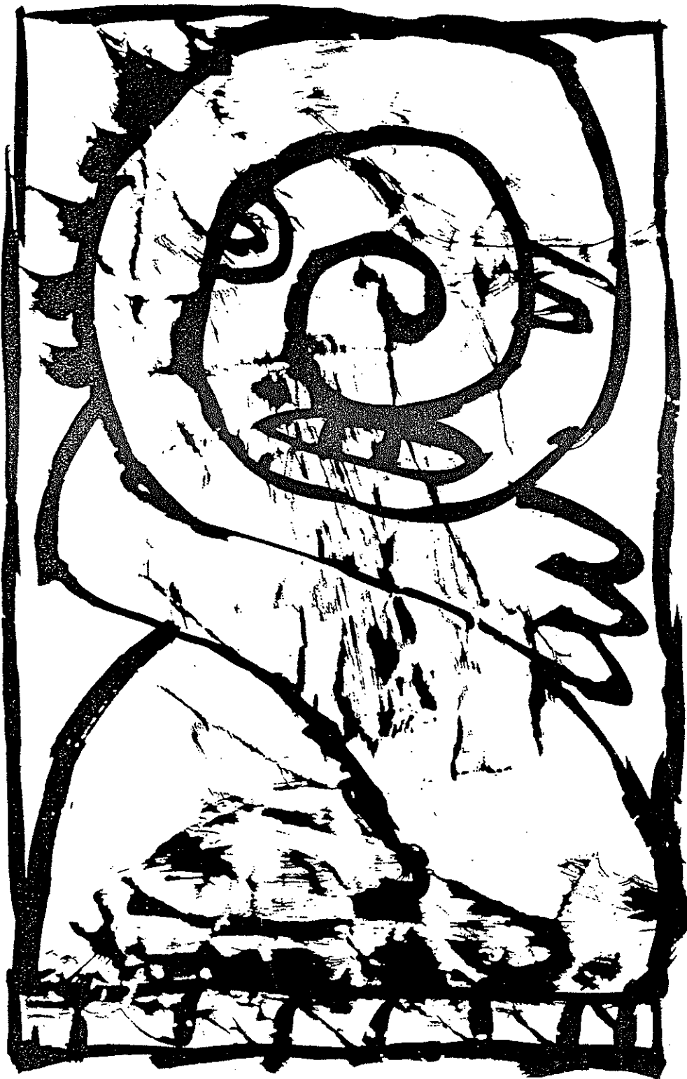
Alechinsky, illustration pour « UBU Roi », éd.Fata Morgana, 1996