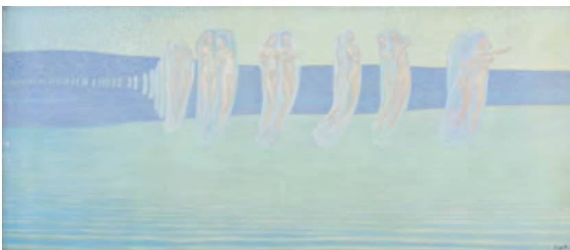
François de Ribaupierre, Chant des esprits sur les eaux , 1909, huile sur toile, 70 x 160 cm. Coll. privée