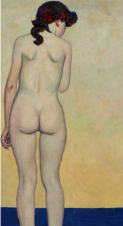
Félix Vallotton, Petite figure nue de dos , 1907, olieverf op hout, 46 x 31 cm. Association des Amis du Petit Palais, Genève