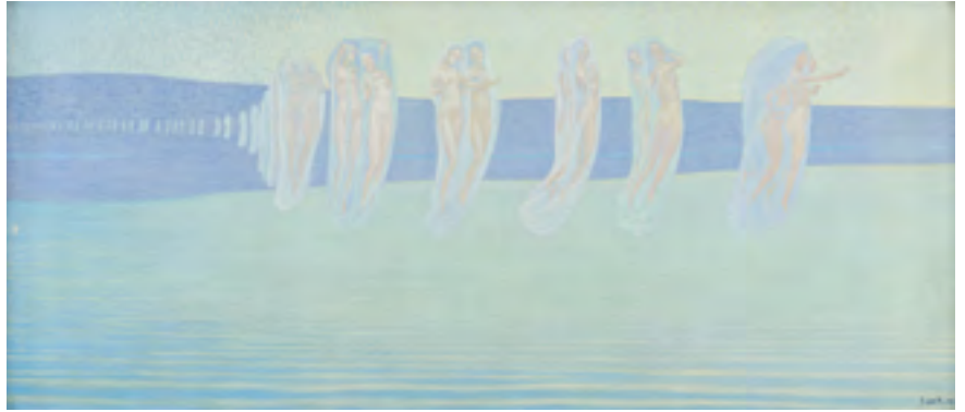
François de Ribaupierre, Chant des esprits sur les eaux , 1909, olieverf op doek, 70 x 160 cm. Privé-collectie © François Bertin Grandvaux