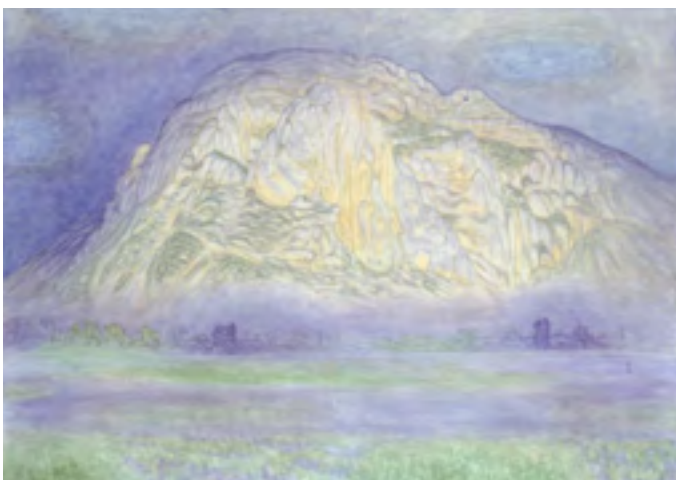
Alexandre Perrier, Le Salève , 1916, olieverf op doek, 82 x 116 cm. Privé-collectie