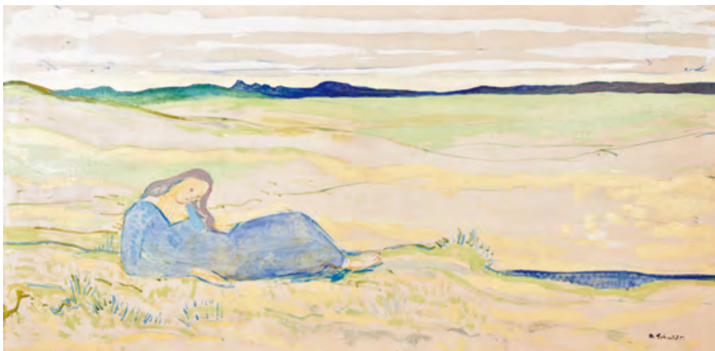
Albert Schmidt, Solitude , s.d., olieverf op doek, 140 x 277 cm. Privé-collectie, Genève

Voor al deze activiteiten, reservatie verplicht: 081/77 67 55