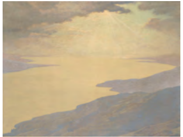
Auguste Baud-Bovy, Sérénité , vers 1896, olieverf op doek, 89,5 x 117 cm. Paris, musée d'Orsay, gift van de kunstenaar, 1898